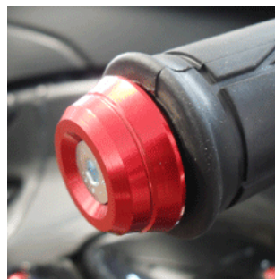
SME12/17 Lenkergewicht konisch für Innen-Ø 12 od. 17 mm