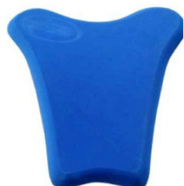
SNB1+2 Sitzpolster 3cm dick für BMW