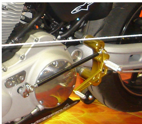
PR040 Rastersatz Harley Davidson XR1200