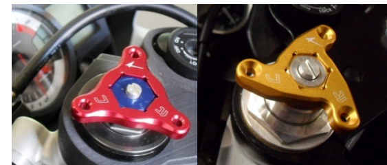
GF22 Standard GFS22 Star Gabelfederversteller BENELLI Tornado und BUELL XB9/12