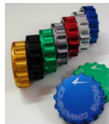
CPF02 Deckel Brems- flüssigkeit CAGIVA Raptor BMW S1000RR