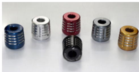
SM12/17 Lenkergewicht zylindrisch für Innen-Ø 12 od. 17 mm