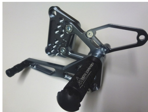
PR036 Raster BENELLI Tornado